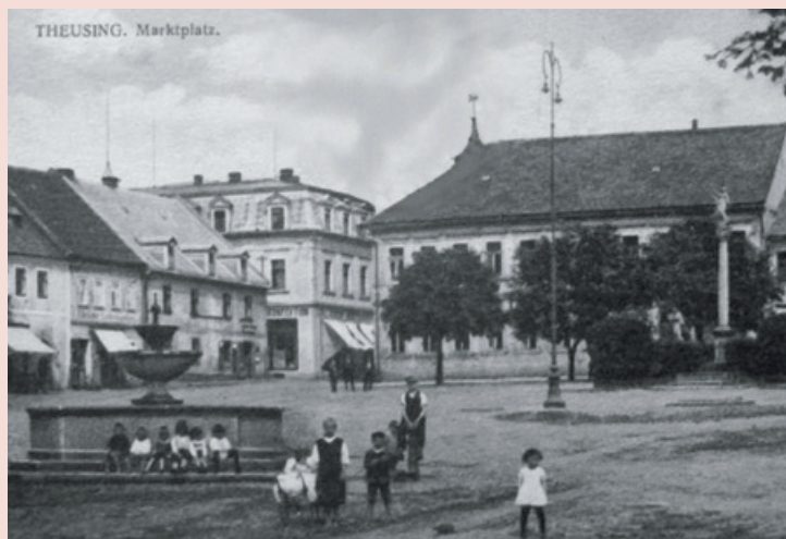
Toužimské náměstí s pouliční lampou z doby elektrifikace města v roce 1922.

Loni jsme zcela bez povšimnutí přešli další 100. výročí, a to od elektrifikace Toužimi. Dnes bereme elektřinu jako zcela běžnou a samozřejmou věc, ale před stoletím to byl nesporně jeden ze zásadních milníků v novodobé historii města, a tak by si i toto výročí zasloužilo alespoň skromné připomenutí. V souvislosti s tím hledáme pro infocentrum fotografii staré zděné trafostanice stávající kdysi v Tepelské ulici.