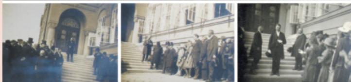
Ze slavnostního otevření nové školní budovy čp. 330 2.9.1923.

Možná si výročí této významné historické budovy a kulturní památky ještě připomeneme nějakou komentovanou prohlídkou či zajímavou přednáškou.