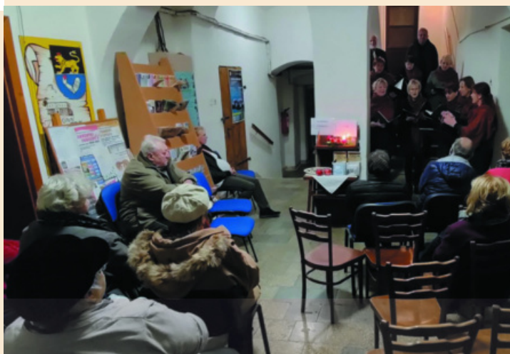
Na netradičním místě proběhl před vánocemi také koncert žlutického sboru Rosa Coeli.