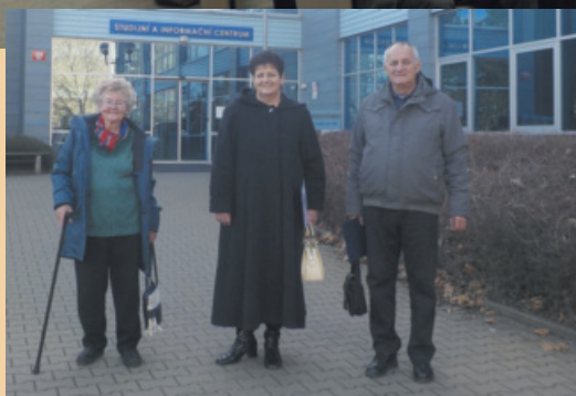
Absolventi VU3V na promoci v Praze dne 15.1. 2020. Blahopřejeme!