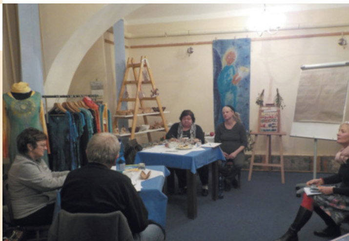
Trénování paměti proběhlo v listopadu a prosinci pětkrát a zapojili se mladší i starší účastníci.