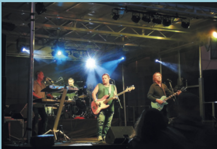
Hudební program Dne města Toužim na náměstí zakončila skupina KEKS.