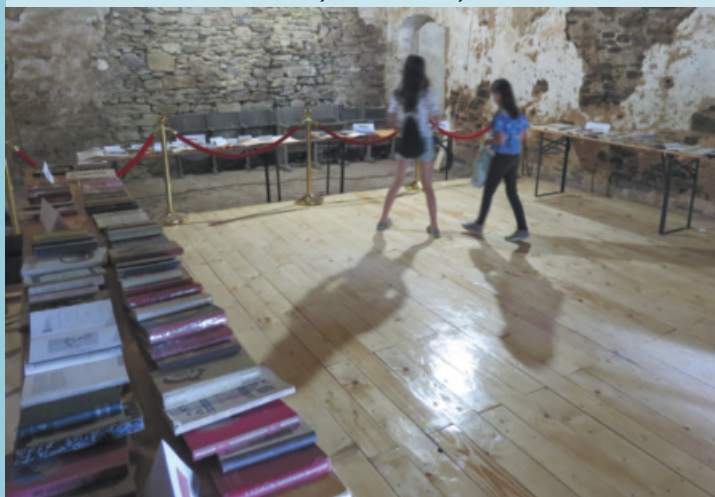
Součástí oslav Dne města byla i sbírka knih "Babička", kterou bylo možné vidět v opraveném sále hradu.