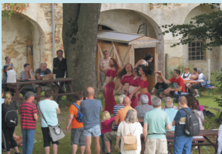
Den města byl letos přesunutý na září a připravený program na zámku i náměstí shlédly na tři stovky návštěvníků.